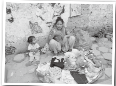
(b)露店をだす母と子ども