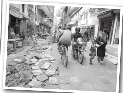
(d)商店街のでこぼこの道