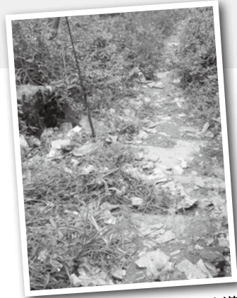
(a)ごみが捨てられている山道