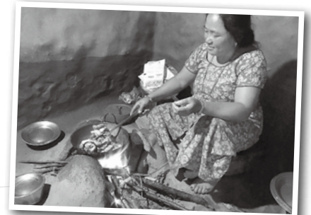
トウモロコシの芯を薪の代わりに燃やす様子

◆所感◆ 5年生のときにも外国の文化を紹介する授業をしていたため、今回の授業をとっても楽しみにしていた児童も多かった。導入で「日本の良いところを聞かれたら、何と答えるか」との質問を投げかけることで、「ネパールの良さは何だろうか」と探しながら授業に参加させるようにした。