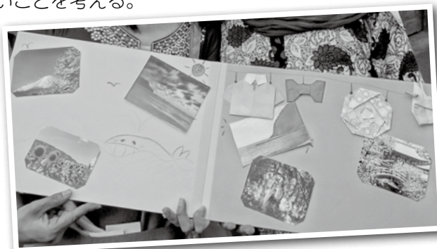
子どもたちが作った写真額

▶ネパールの人に聞いてきてほしいことや、文化交流として持って行ってほしい物のアイデアがたくさん寄せられた。