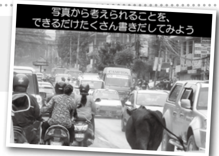
ネパールの交通の様子